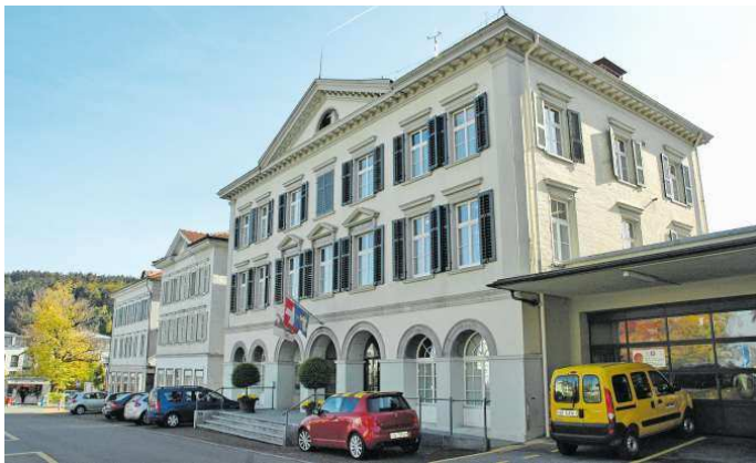
Die Gemeinde Heiden will die ersten Sparmassnahmen 2021 umsetzen.

Die Umsetzung des Entlastungsprogramms soll in drei Pa-